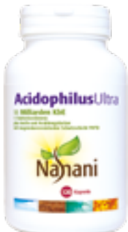
120 Kapseln (Code 0495)

Unterstützt maßgeblich die Eliminierung der Giftstoffe über den Darm und sorgt dafür, dass die von der Darmwand gelösten toxischen Rückstände schnell ausgeschieden werden