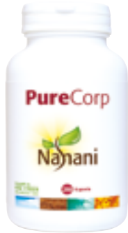
210 Kapseln (Code 0133)

verhindern, dass sich im Lauf der Zeit Giftstoffe im Körper und verhärtetes Material an den Darmwänden ansammeln. Dieses Programm stellt eine zusätzliche Art von Vorbeugung und Stärkung des Immunsystems dar und kann ein- bis zweimal jährlich durchgeführt werden, am besten im Frühling und Herbst.