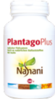
340 g (Code 0085)

16 Heilkräuter, welche die Giftstoffe, die sich im Lauf der Zeit im Körper angesammelt haben, über den Darm und die Nieren ausleiten. Auch lymphreinigende und blutreinigende Heilkräuter sind enthalten